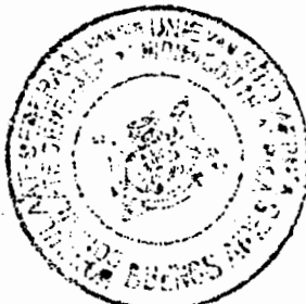
A. T. TENDYK CONSUL GENERAL DE LA UNION SUD AFRICA

Por la presente doy mi conformidad al contenido de la misma y aprovecho la oportunidad para renovar al Sr. Ministro las seguridades de mi más alta estima y consideración.